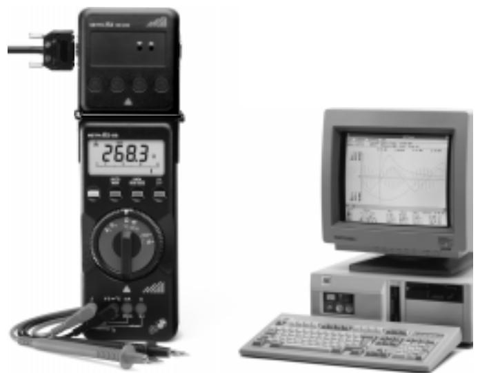
PC mit METRAwin®10/METRAHit® und Digital-Multimeter mit Schnittstellenadapter METRAHit®BD232

Die Software METRAwin®10/METRAHit® (lauffähig unter WINDOWS ab 3.11) dient zur Verarbeitung und Darstellung von Meßdaten in einem PC. Die Abtastung kann manuell mit einstellbarem Abtastintervall oder signalabhängig (mit einstellbarer Signalhysterese) erfolgen. Die Speicherung im ASCII-Format kann von je zwei Triggerschwellen pro Meßkanal sowie über die Systemzeit gesteuert werden.